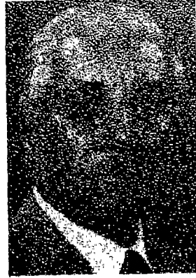
عبد الوهاب البياتي